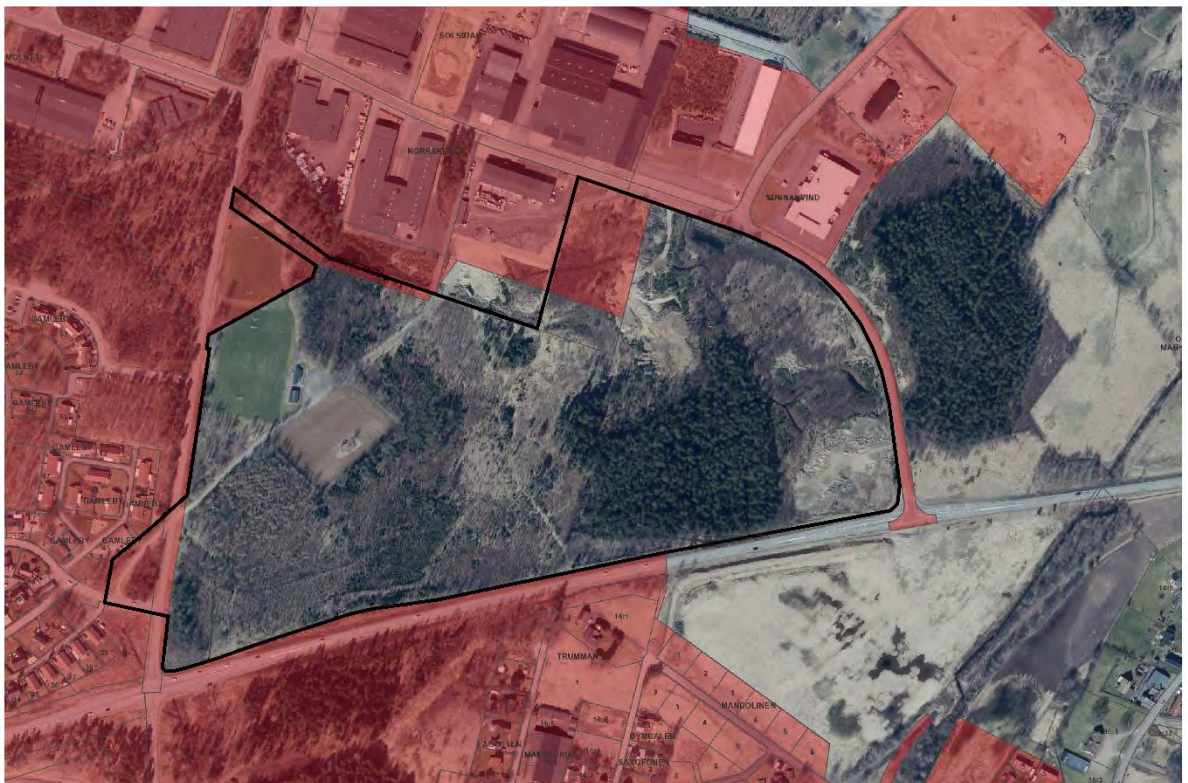
Ungefärlig avgränsning av planområdet med svart markering.